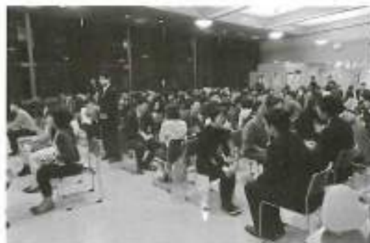
1分間の自己紹介タイムで自己PR

本イベントは、名取市企業連絡協議会主催、名取市商工会・(公社)仙台南法人会共催で行われ、当日のイベントの企画・運営は、本会青年部・仙台南法人会青年部の方々に協力いただきました。