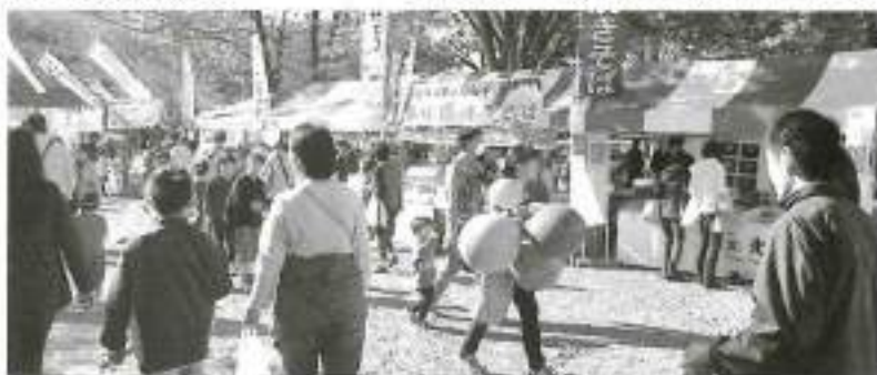
昨年よりも多く集まった出店コーナー

イベント当日は、さわやかな秋空の下、上棟式（餅まき実演）、ステージショー、農林水産物の販売、緑日コーナー等の他、今回は、市制施行六十周年記念として、名取市体育館内にて、「ふりかえる名取展」が開催され、一万七千人の来場者で賑わいました。 ステージでは、関上太鼓の勇壮な演奏や、子供たちによるミュージカルや華麗なチアダンスの披露がありました。