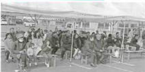
会場には多くの来場者が訪れました

今年で七回目の開催となった『鍋まつり』では、各店趣向を凝らした五店の自慢の鍋や温かい汁物が各店一杯三〇〇円で販売され、『さんまのつみれ汁』の他、名取産のせりの入ったふかひれスープやホルモン鍋等のバラエティ豊富なメニューが提供されました。また、会場内では、市場内店舗で使用できる五〇〇円買物券（一〇〇〇円相当分）の販売が先着で行われた他、当日のビンゴゲーム券のプレゼントと併せた企画も好評で、多くの来場者を楽しんでいました。