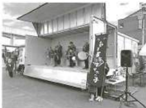
オープニングのすずめ踊り