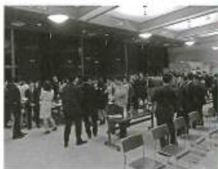
和やかに行われたフリートイム

今回は、各テーブルにて競うミニゲームを行わず、できるだけ多くの参加者の方々と「コミュニケーション」を取れる様、「お見合い回転すし」形式で交流の場を設けました。一回のお見合い時間は、約一分間と、とても短い時間ではありましたが、限られた時間の中で思い思いの会話を楽しんでいくようでした。 その後、フリートイムに入ると、テーブルに用意された工場出来立てビールと美味しい料理を堪能しながら、参加者は、各自気になった方を見つけ、会話を弾ませていました。時間の経過とともに、参加者同士が打ち解け合い、フリートイム中に積極的なアピールが行われ、十組の力ツノルが成立となりました。 参加者からは「多くの方と交流出来て楽しい時間を過ごすことができた」、「来年も参加したい」等、「ご好評頂き盛会のうちに終了いたしました。」