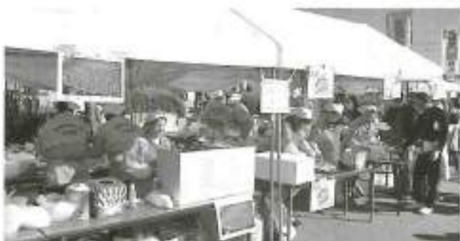
玉こんにゃくや赤飯等を販売した女性部コーナー

一方、会場内の出店エリアでは、前年よりも多い八十一団体に参加し、産直野菜の販売や、名取名物せり鍋などが販売され、姉妹都市の山市や新宮市の美味しい特産品の販売や笹かまぼこ無料体験コーナー、動く車コーナーなども大好評でした。