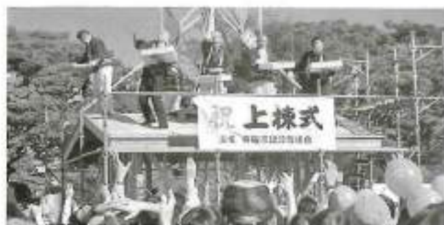
餅まきでは多くの人々が手を伸ばしていました！

名取三大祭り「2018ふるさと名取秋まつり」が、十一月三日（土）文化の日に体育館アリーナ及び駐車場にて開催されました。