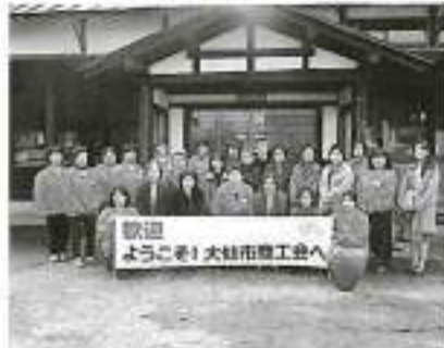
大仙市商工会女性部の皆様と

内容に参加者は大変刺激を受け、今後の本会女性部おもてなし交流事業内容に更に磨きをかけ、地域振興と活性化に寄与して参ります。