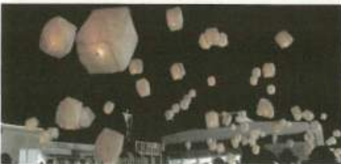
夜空を舞うスカイランタン