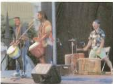
南アフリカ これが楽器「ジェンベ」の演奏