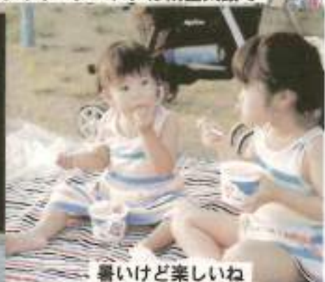
暑いけど楽しいね