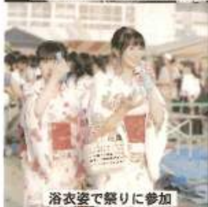
浴衣姿で祭りに参加