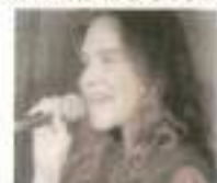
ジユティス(ボーカル)