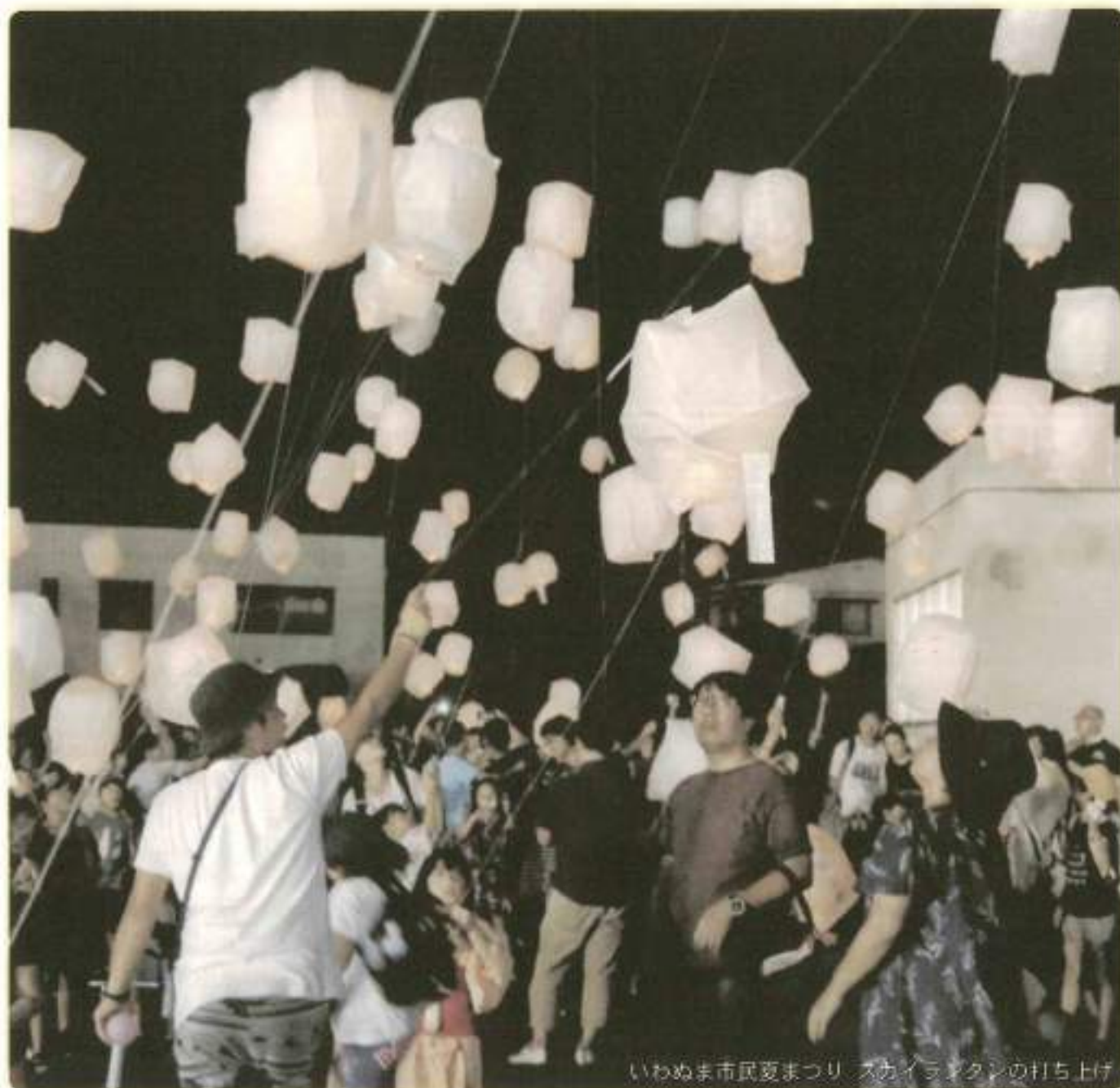
いわぬま市民夏まつり スカイランタンの打ち上げ