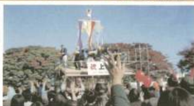
11月3日恒例の秋まつり開催予定 (写真は昨年写真)