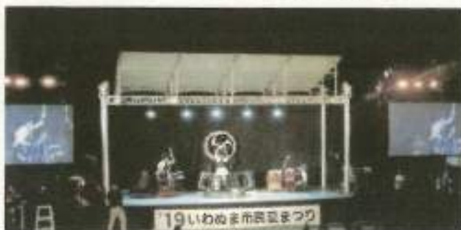
フィナーレの和太鼓の演奏