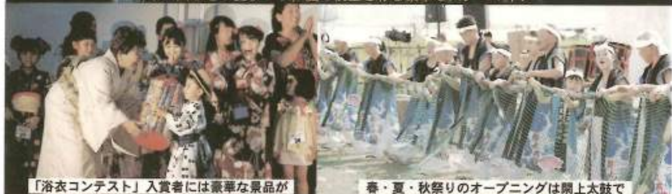
「浴衣コンテスト」入賞者には豪華な景品が