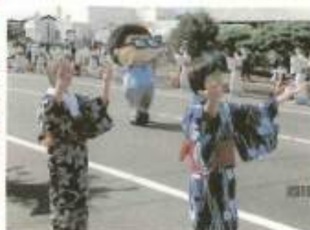
岩沼音頭に岩沼係長も参加しました!