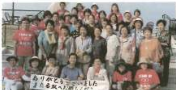
ありがとうございました

会を行った。本会女性部が手作りで作成した「南天九景」をお渡しし、女性部員同士の親睦を深めることが出来ました。 日和山や東日本大震災慰霊碑を巡り、「閉上かわまちてらす」にて買い物を楽しんでいたとき復旧・復興から発展へ向かう名取市の雰囲気を感じただけだと感じます。今後も交流だけでなく名取市のPRを全国に発信して参ります。