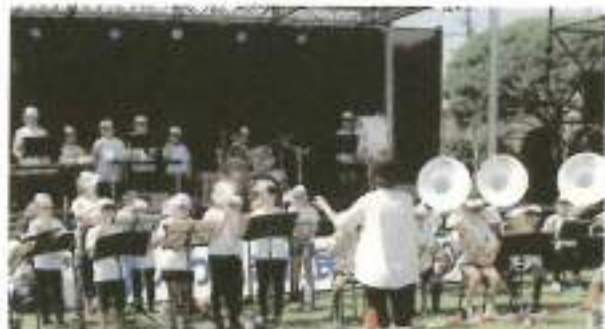
岩沼小学校金管バンドによる演奏

まつりの最後には、和太鼓とファイナル花火とのコラボレーションが行われ、大勢の市民はゆく夏を惜しみ、夏のひとときを過ごしました。