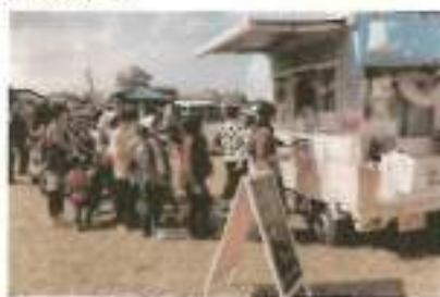
キッチンカーイメージ写真