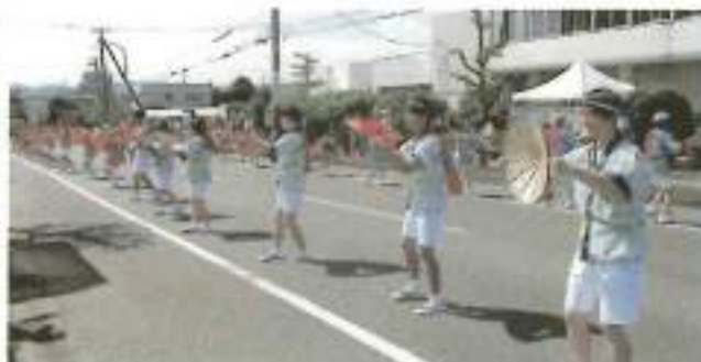
尾花沢市のみなさんによる花笠音頭