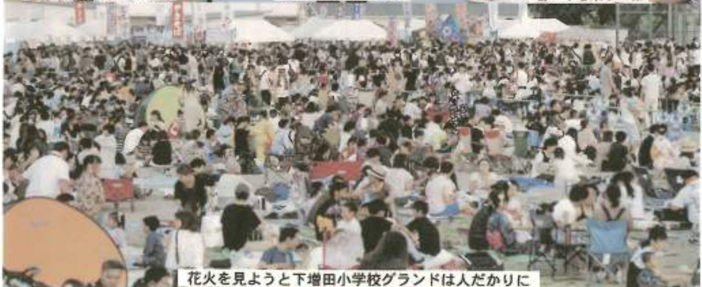
花火を見ようと下増田小学校グラウンドは人だかりに