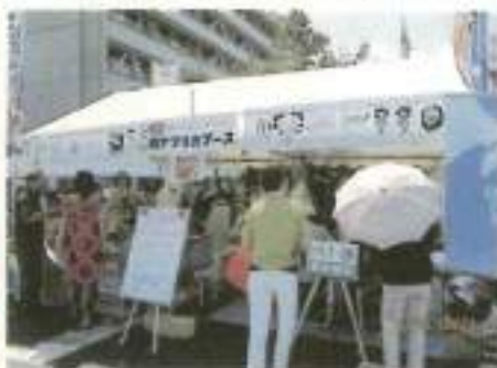
南アフリカ観光局ブース