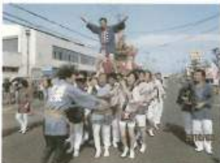
勇壮な神輿は、楽団総会のみなさん