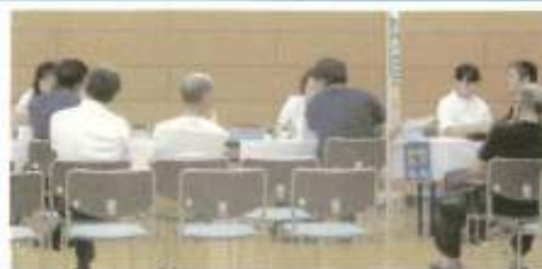
定期健康診断を受診する従業員の皆さん

従業員定期健康診断が実施されました 岩沼市商工会では八月二十六日～三十日の五日間、勤労者活動センターにて、(財)社の都産業保健会の協力のもと、会員従業員の定期健康診断を実施しました。事業者には従業員の健康状態を管理する義務が、労働安全衛生法で規定されており、これによって使用者は従業員に対して健康診断を受けさせる義務があります。事業者は従業員の健康管理を行うとともに法令等を厳守し、ストレスフリーな職場環境づくりに努めましょう。