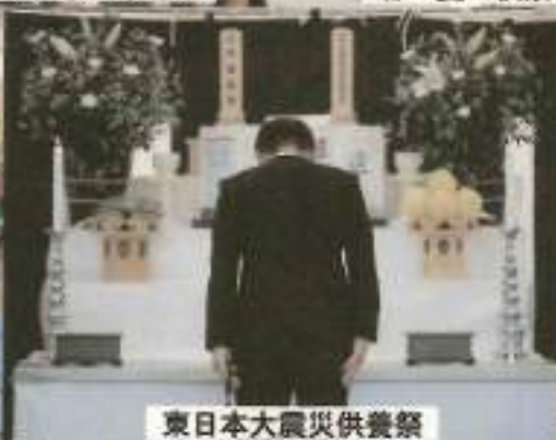
東日本大震災供養祭