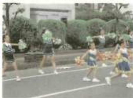
チアダンスの披露もありました!