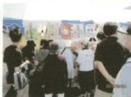
多くの人で賑わう物販ブース