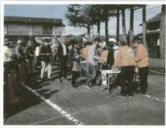
商品券販売開始直後の様子

中心市街地の活性化と交流人口の増加を図り、市民との交流を通じて岩沼市のまちを元気にすることを目的に、十月二十六日(土)に「福幸市コンタ君の倍返しラリー」を開催しました。 今年で九回目となった福幸市では、約五〇店舗が参加し、先着八〇〇名の方々に二、〇〇〇円分の商品券を、一、〇〇〇円で販売し、買い物や食事をしながら商店街を歩いて楽しんで頂きました。 当日は、竹駒神社参集殿の駐車場で商品券を販売しましたが、商品券を求めて早朝から並んで待つ方々も見られ、あつという間に完売しました。