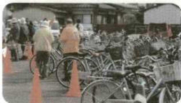
自転車による来場者も沢山いました