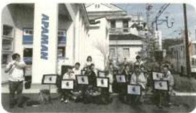
【岩沼歩いて暮らせるまちづくりネット】ウィンドアンサンブルプレーメン