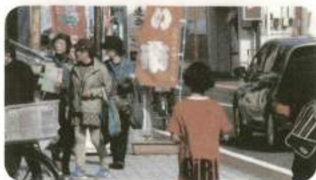
商店街と協力し、よい市と同時開催!