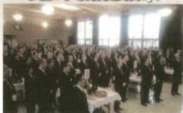
280名の大勢の参加申込のある新春祝賀会1/7開催予定