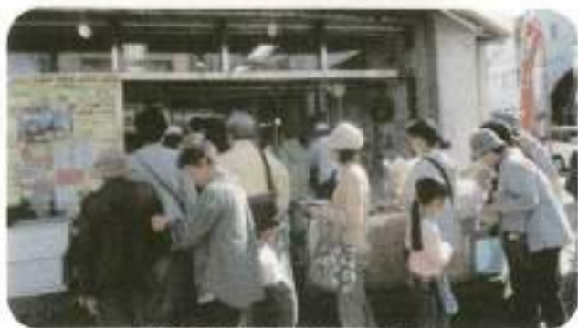
新鮮な食材をもとめて並ぶ参加者