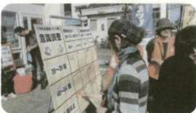
【あるいて健康づくり隊】健康習慣について意識調査を実施