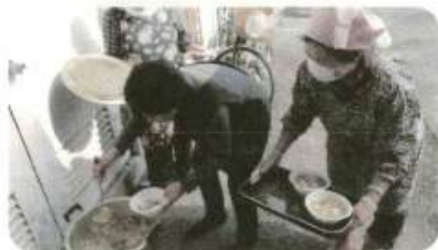
完全手作りの愛情たっぷりのすいとん