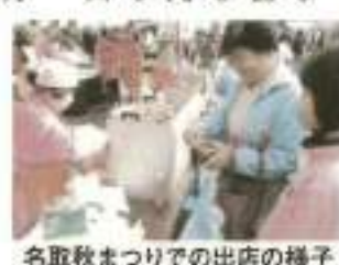
名取秋まつりでの出店の様子

また、十一月三日「名取秋まつり」への出店を行い、例年好評をいただいている「いも煮・お赤飯・玉こんに」を提供いたしました。