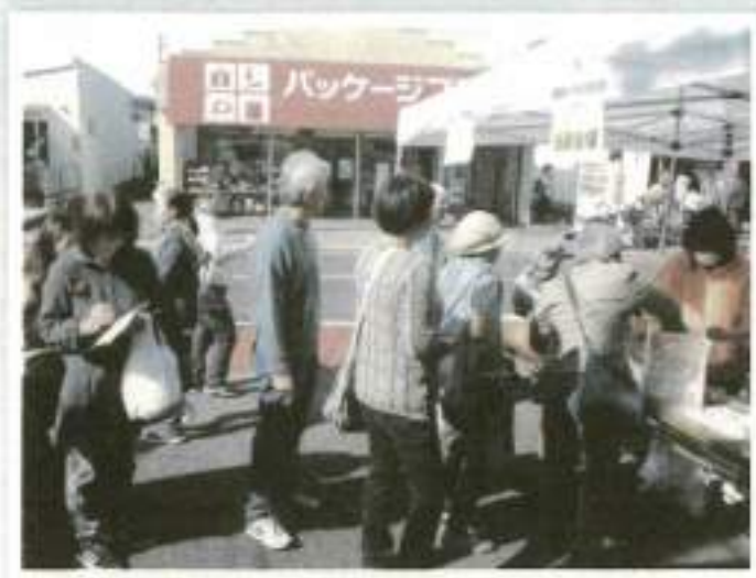
商工会館では、必ず当たるおたのしみ抽選!

また、商工会館前では、三つのブロックのスタンプを集めてお楽しみ抽選会に参加した消費者が豪華な賞品を手にし、大喜びの声を上げる姿も見られました。 商店街では、特色のある商品などが店頭並び、大きな買い物袋を持った消費者の方々が賑わいました。 また、「いわねま健康づくり隊」の協力をいただき、万歩計を七十名の方に貸出し、買物を行いながら歩数を計測し、抽選会に参加できるイベントや、「歩いて暮らせるまちづくりネット」主催によるイベントも行われました。