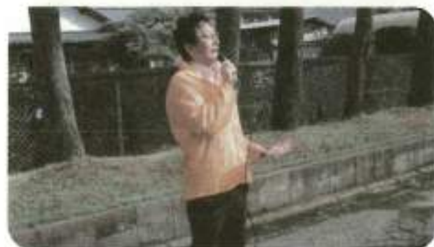
開会挨拶を述べる大友会長