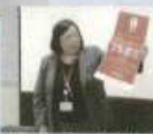
決済事業者からの説明