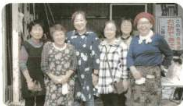
【女性部】すいとんをふるまい、参加者をおもてなし