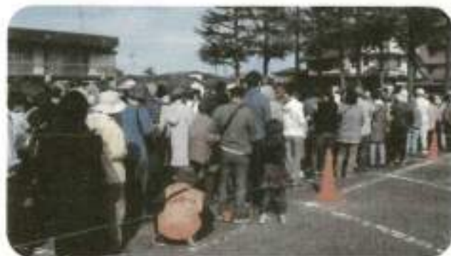
商品券を求めて並ぶ、人・人・人