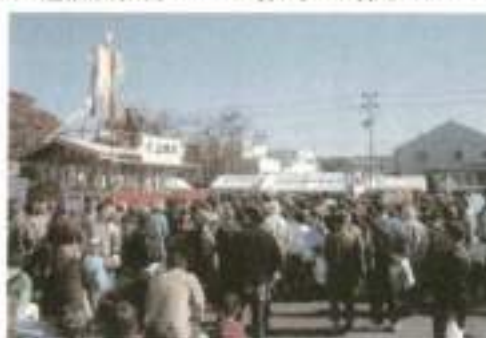
上棟式に集まる来場者

かのように人垣が出来、餅やお菓子などを拾って楽しんでいた。第9回となる「元気なとり工業展」も年々参加企業数が増え、名取市の企業のPRをしていた。姉妹都市の上山市長も一通り見学して行かれ、年々盛んになる名取秋まつりが衰退もせず年々盛んになっている様子を羨ましがって帰られた。午後3時までの5時間のイベントであるが大いに賑わいました。