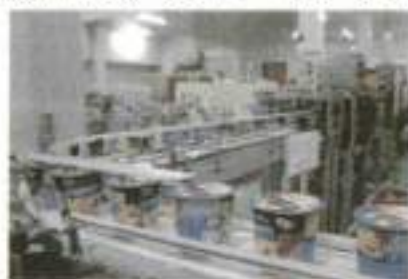
最近の製造ラインで生産されるカップ入りスープ

現在の製造品目はカップ入りスープ「じっくりコトコトこんがりパン」シリーズの「ラムチャウダー」「完熟かぼちゃポータージュ」「じゃがいもバターポータージュ」の3種を造っている。今回名取市商工会の会員となり、名取市に貢献したいので今後共益しくお願いします。会員の皆様にも名取市で生産された商品ですので是非ご賞味頂ければと思っ取材を終えました。