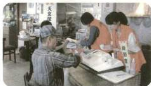
骨密度や血管年齢測定を実施