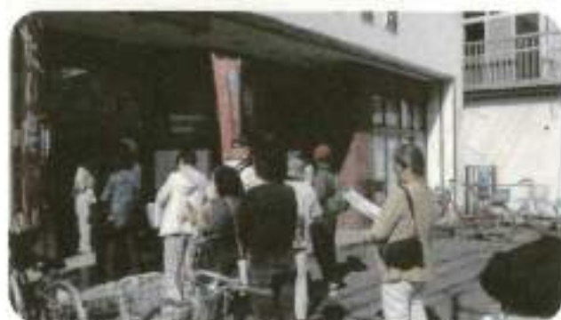
商店街は多くの参加者で賑わいました