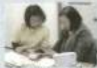
個別相談会の様子