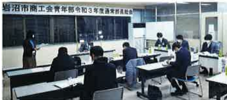
岩沼市商工会青年部令和3年度通常部員総会

地域活性化事業や岩沼市の地域創生・商工業者の後継者対策事業の企画運営を行い、青年部員相互の人的ネットワークを生かした事業を実施するとともに、各種研修会等に参加し、経営者としての意識高揚と資質向上を図り、地域活性化及び組織活性化に努めて参ります。