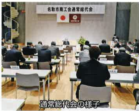
通常総代会の様子

御ラインとなる高産土の道路が開通。更には、温泉施設を兼ね備えたサイクルスポーツセンターがオープンするなど、すばらしい街が形成されつつあり、商工会も市の協力の下、冷え込んだ消費活動の促進を図るため、割増商品券の発行や事業継続のための国・県・市の支援策に対する申請支援、更には新型コロナウイルス感染症等の影響により経営環境が悪化している中小企業者に対して、専門家による個別相談会を開催するなど、会員に寄りそった支援を展開してきた。また、挨拶の最後には「愛されるふるさととなり。共に創る未来へつなぐ」人々