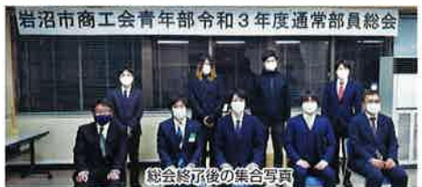
岩沼市商工会青年部令和3年度通常部員総会