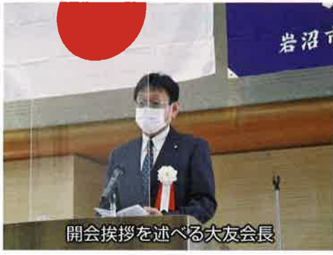
開会挨拶を述べる大友会長

また、自然災害が頻発し、中小事業者が築き培ってきた経営資産に大きな被害を受ける事態が全国で発生しております。