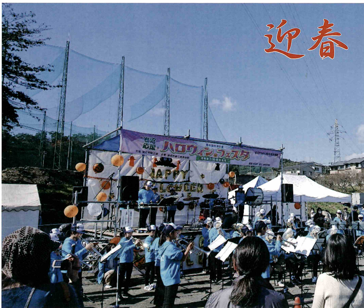
地元企業応援事業「青年部の地元愛 岩沼応援ハロウィンフェスタ～市制施行50周年記念～」