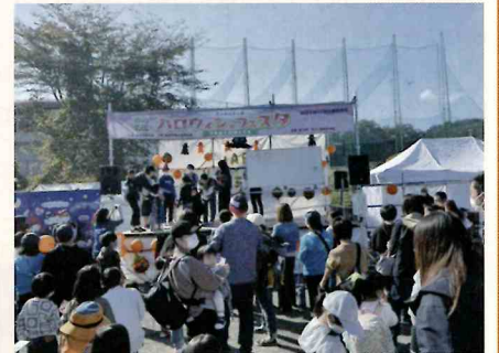
【ビンゴゲーム大会】