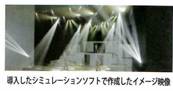
導入したシミュレーションソフトで作成したイメージ映像

感染対策をしながらの公演は課題も多く、その中でも取引先との打合せ方法が大きな課題で、「何度もお互いに会って打合せを重ねることが重要ではあるが、何度も会わなくても念入りの打合せはできないものか?」と社内で協議を行ったところ、「シミュレーションソフトを使って視覚化した照明プランをデータ化し、お客様に提供できないか。」と意見があがりました。シミュレーションソフト導入にあたり、小規模事業者持続化補助金を活用できないかと商工会に相談し、事業計画の作成支援を受け採択となりました。導入後はシミュレーション