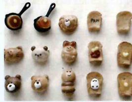
◀本物の竹串と笹かまぼこを使ったグッズ>> <<本物のパン生地を使ったバングッズ>> GuuRe. 8 E-mail: guurehattii@yahoo.co.jp TEL: 090-7937-6947