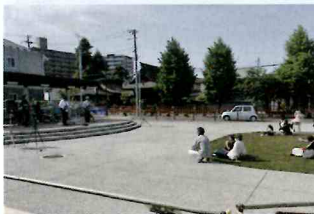
なとポップの様子

名取市商工会及び名取市企業連絡協議会では、会員事業所の企業発展に繋がる事業を引き続き実施して参ります。