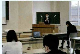
名取市企業連絡協議会名取市長講演会の様子