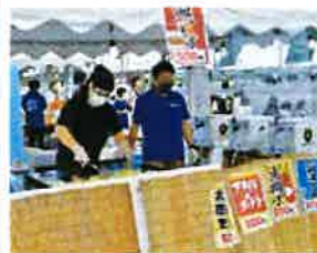
出店準備中の様子

コロナ禍でイベント自体久しぶりでしたが、部員相互の関係性を強化することができたこと、また地域と青年部の繋がりを再認識することができました。