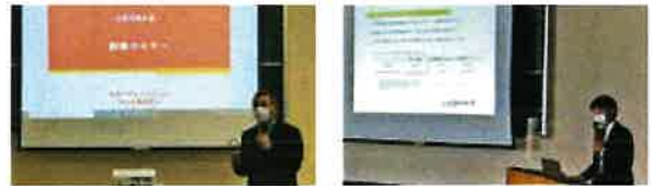
昨年の創業セミナーの様子

【申込方法】 広報なとり11月号折込の参加申込書に必要事項をご記入の上、名取市商工会へFAX等でお申込み下さい。