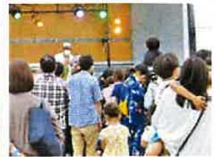
こどもクイズ大会の様子