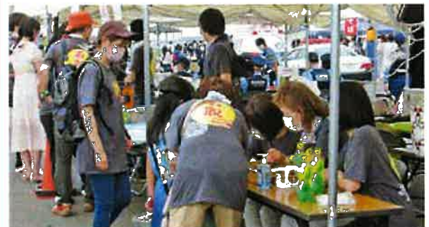
迷子になった女兒を優しく迎え入れる女性部員たち

来年は今年以上の盛況を目指し、女性部は人の和を大切にして日々活動してまいります。