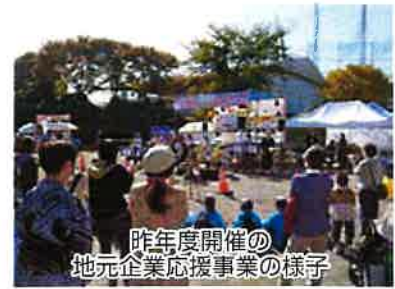
昨年度開催の 地元企業応援事業の様子

実施日時：令和4年10月29日(土)午前10時～午後3時 ※荒天の際は中止 実施場所：金蛇水神社(岩沼市三色吉字水神7) ※新型コロナウイルス感染症拡大状況により、中止する場合がございます。ご了承ください。