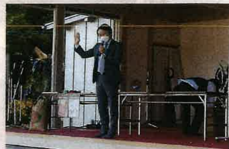
【岩沼市 佐藤市長ご挨拶】