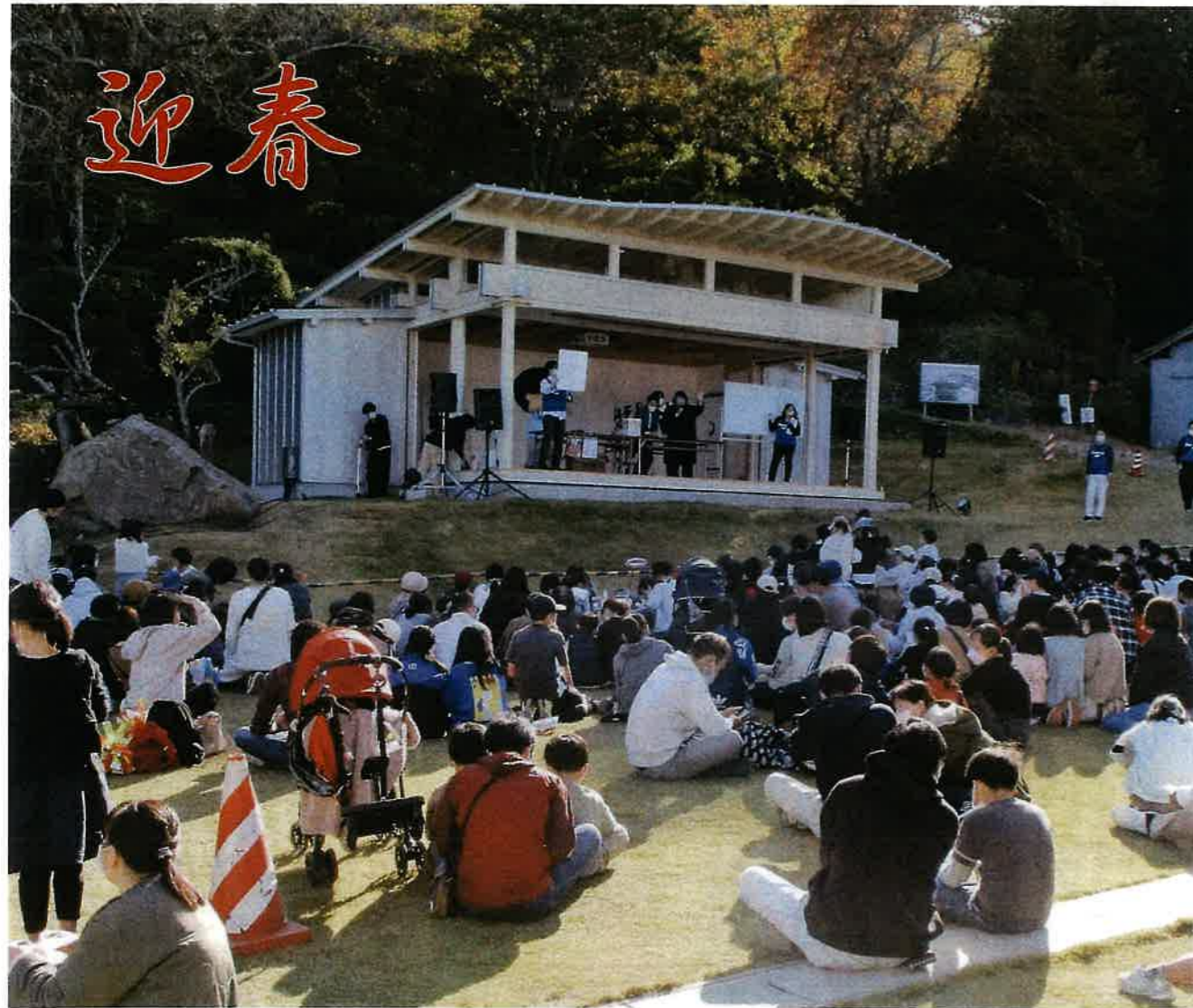
地元企業応援事業「青年部の地元愛 岩沼応援オータムフェスタ」