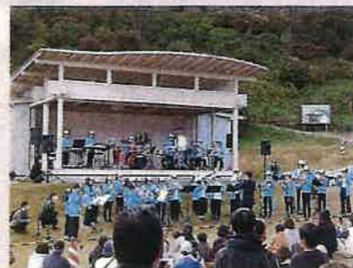
【ステージ会場の様子】