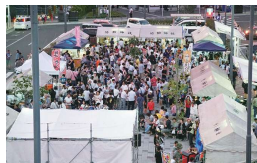
過去の岩沼駅前活性化事業の様子

JR岩沼駅前にて、おいしいフードで真夏の暑いひと時を楽しく過ごしませんか？子どもが楽しめるブースも用意しております。ご家族、ご友人等お誘いあわせのうえご来場ください。