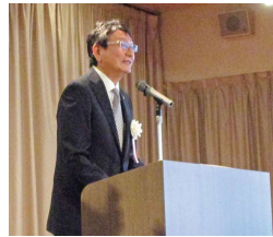
開会挨拶を述べる大友会長

大友会長は開会挨拶で、「新型コロナウイルス感染症が国内で初めて確認され三年が経過し、経済に大きな影響を及ぼしている状況の中で、ウイズコロナの新しい生活様式への考え方を踏まえた新たな段階へ移行、社会経済活動の正常化に向けた取組が進んでおります。昨年九月にはおよそ二十四年ぶりの円安ドル高による影響もあり、疲弊した状況に追い打ちをかけ、コロナ以前の水準へは回復は見通せない状況にあります。また、昨年二月に始まっ