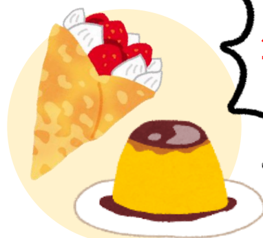
銘柄卵を使ったスイーツ