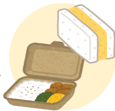
銘柄畜産物を使った お弁当、サンドイッチ